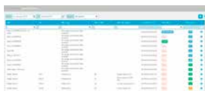
5. Opvolging van alarm- en storingsvoorspelling