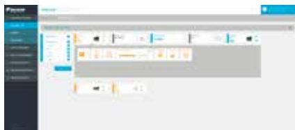
1. Monitor en bestuur uw systeem