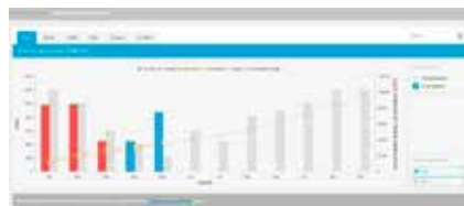
2. Vergelijk het energieverbruik met het doel