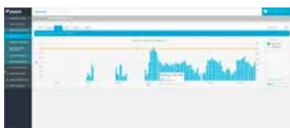
4. Uitgebreide analyse van energieverbruik