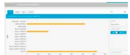
3. Vergelijk het energieverbruik van verschillende locaties